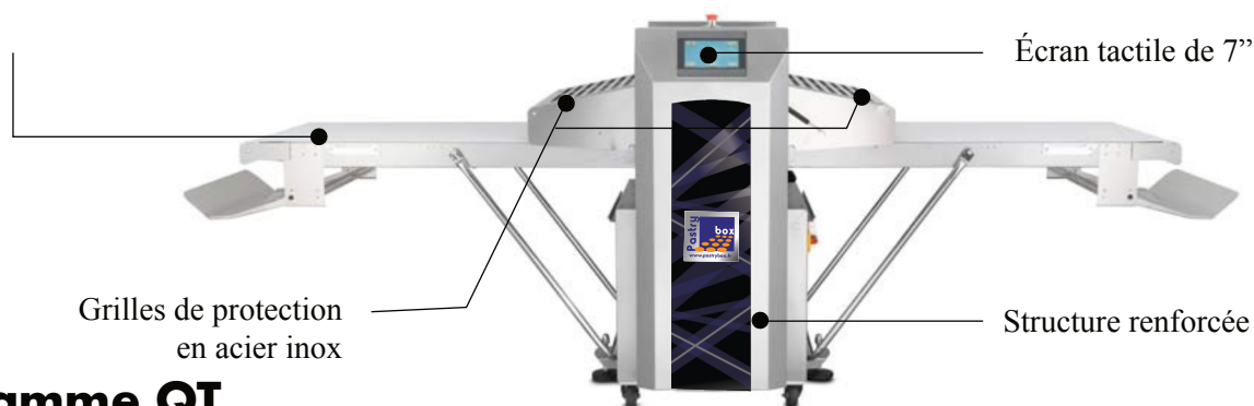
Table + tapis